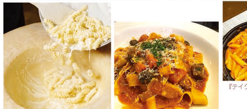
▲『パルミジャーノ・レッジャーノで仕上げるチーズ好きのための5フォルマッジョ(1650円)』