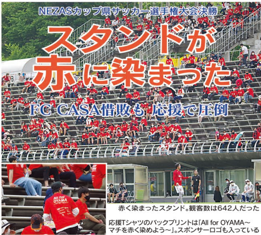
赤く染まったスタンド。観客数は642人だった