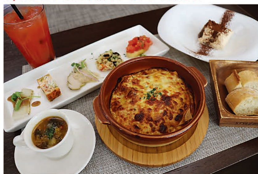
『Bランチ(1650円)』前菜の盛り合わせ・パスタorラザニア・小さい皿・ドリンク・デザート