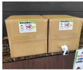
次亜塩素酸水 12L 1箱 / 3,000円(税別) 12L 2箱 / 5,000円(税別)

次亜塩素酸水に対する誤った報道がワイドショー等でありましたが、低濃度（10ppm～30ppm）の気体状次亜塩素酸水はバナソニック社のジアイーノに代表され、使用を推奨されています。既に多くの事業所や医療施設の感染クラスター防止に活躍しています。これまで飛沫対策が主で、アeroゾル感染・空気感染のリスクに対する対策が欠けていました。簡単な超音波式加湿器での噴霧が可能です。