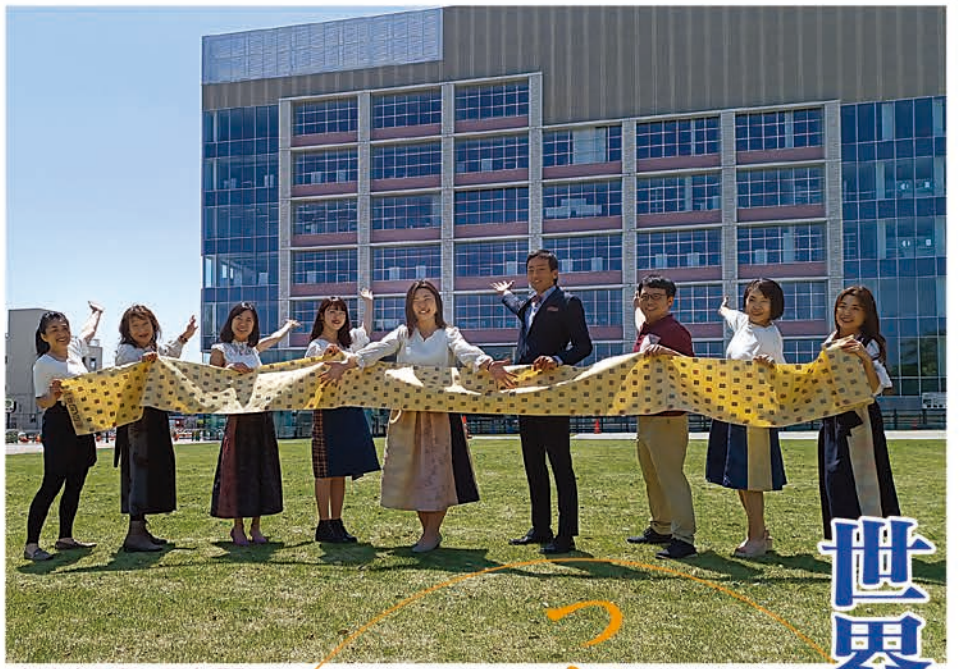
新庁舎を背に記念撮影